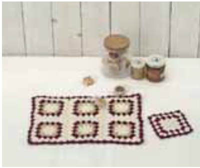
デザイン／岡本啓子 製作／足立加奈子