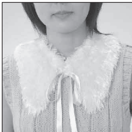
デザイン/城戸珠美